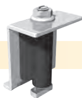
Conjunto do Grampo Terminal

Cada sistema Power Peak é fornecido com componentes pré-montados de fábrica, o que reduz o tempo de instalação e os custos. Componentes predefinidos não somente evitam peças soltas no local, mas também eliminam medições e simplificam a instalação.