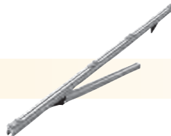
Montagem de Braço de Sustentação