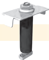
Conjunto do Grampo Intermediário