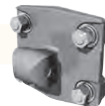
Montagem da Fixação de Suporte

Power Peak é a mais nova solução de montagem de chão comprovada no campo pela PLP Solar.