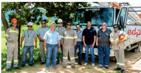
Equipes PLP e EDP Brasil, Caraguatatuba, SP

lador Pilar Polimérico nas rede de distribuição com cabos nus, da EDP Brasil. Foram escolhidos dois locais distintos, um deles próximo na orla marítima. Este será um teste importante, pois o produto não foi projetado para aplicação em regiões tão agressivas; neste local, foram instalados seis isoladores em cruzetas com condutores nus. A PLP e a EDP irão acompanhar o desempenho dos isoladores em ambiente com agressividade marítima. E, no dia 9 deste mês, a instalação foi realizada em uma Rede Compacta de 15 kV, localizada no condomínio residencial 'Minha Casa Minha Vida', em Pindamonhangaba, cidade na região central do Vale do Paraíba Paulista, no Estado de São Paulo. Os Isoladores foram instalados em duas estruturas "CE2", sendo uma em ângulo e outra em derivação.