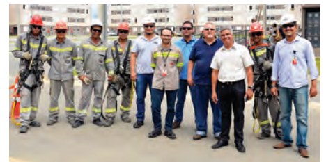
Equipes PLP e EDP Brasil, Pindamonhangaba, SP